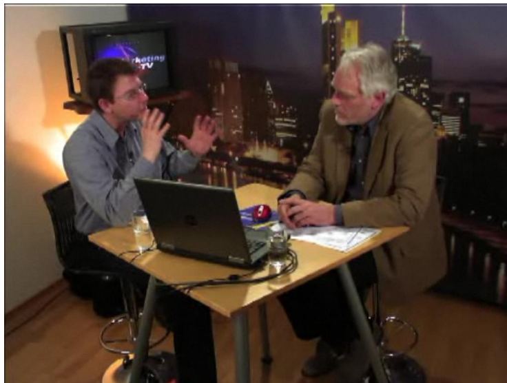
Bild: Livestream ohne Webinar Plattform

Streaming-Only events gleichen schon fast einer WebTV-Sendung. Zuschauer können bei einer WebTV Sendung in der Regel nicht interagieren (kein Chat), sondern sind reine Konsumenten. Mit Hilfe von geeigneten Bildmischern, kann ein Computer als Videoquelle genutzt werden, um so auch Präsentationen oder Anwendungen einzublenden. Bei Streaming Only wird keinerlei Webinar Plattform benötigt, sondern lediglich ein „Player“, der den Stream auf einer beliebigen WebSite darstellen und abspielen kann. In der Regel wird der Player vom Streaming Anbieter zur Verfügung gestellt.