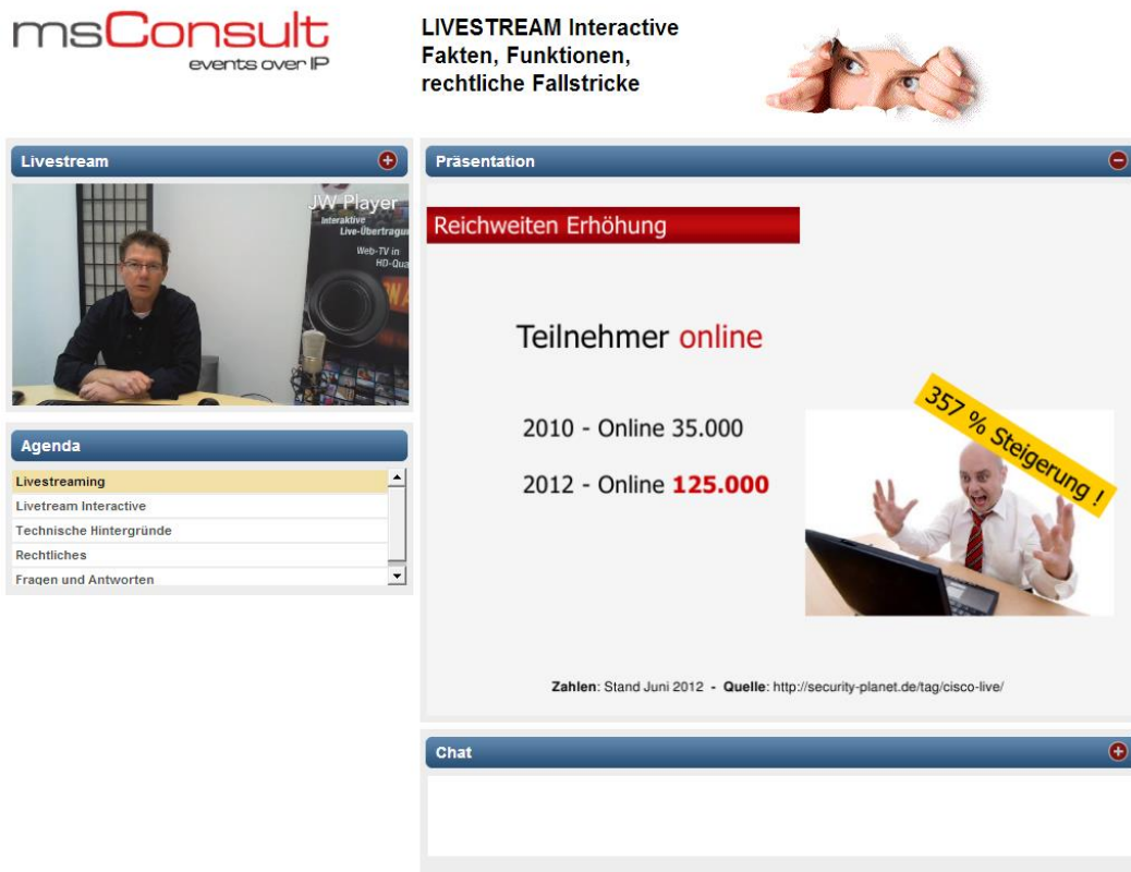
Bild: Livestream mit Präsentation und Chat

Anders, als bei einem Audio & Video event, kommt beim Live-Streaming in der Regel professionelle Kamera- und Tonausrüstung zum Einsatz. Nahezu in TV-Qualität werden hierbei Bild und Ton übertragen. Der Zuschauer kann per Klick auf das Live-Bild in den Vollbild-Modus wechseln. Mit dem Einsatz von Live-Streaming können eine Fülle von Live Veranstaltung-Arten wie Podiumsdiskussionen, Interviews, Pressekonferenzen, Produktvorführungen u.v.m. übertragen werden, ohne auf Präsentation, Chat und das Whiteboard verzichten zu müssen.